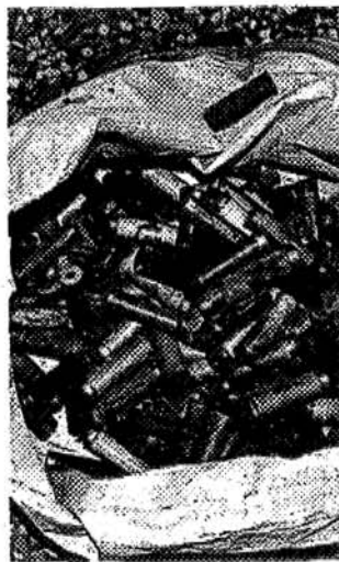
Le armi e le munizioni rinvenute sull'autostrada A-12 Genova - Livorno, tra Lavagna e Sestri L.